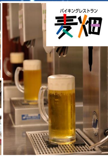
御殿場高原ビール「バイキングレストラン麦畑」(イメージ)