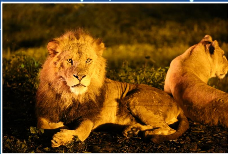
富士サファリパーク・ナイトサファリ (イメージ)