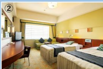
東京ディズニーリゾート®オフィシャルホテル ①ホテル外観 ②客室イメージ