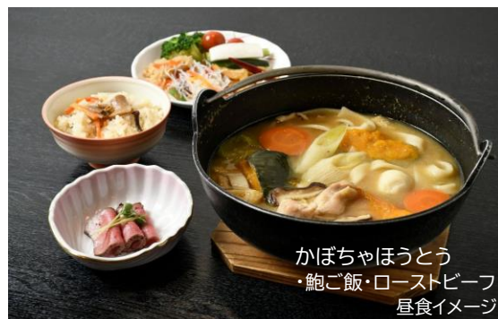
かぼちゃほうとう ・鮑ご飯・ローストビーフ 昼食イメージ