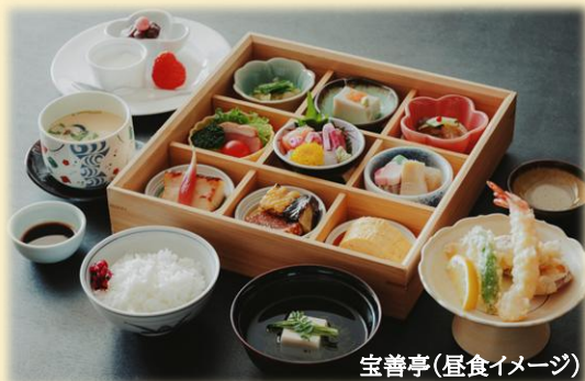
宝善亭(昼食イメージ)