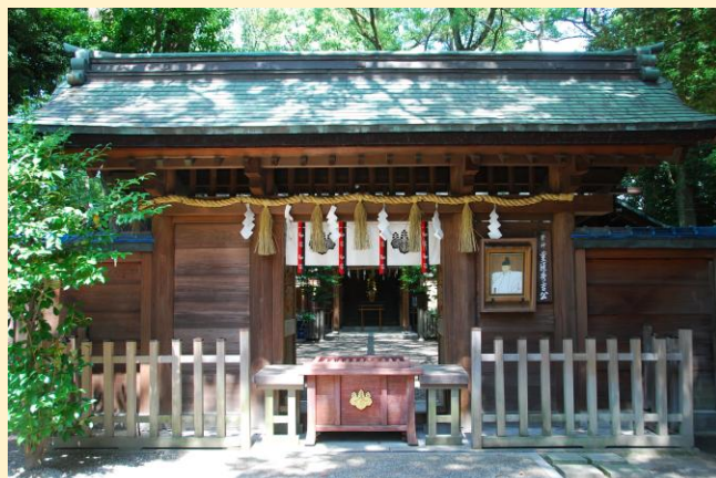
豊國神社

ご旅行日 <日帰り> 最少催行人員(25名) 2026年 5月23日(土)・31日(日)